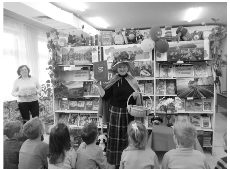
Они красивым пением Оплатят нам весной!

Не пожалейте времени – Кормите птиц зимой!